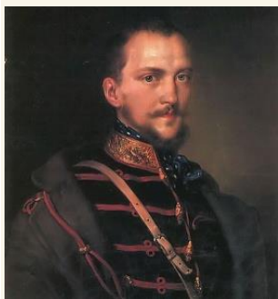
Görgei Artúr Barabás Miklós festményén

A tavaszi hadjárat sikerei után sokan vélték úgy, hogy Ausztria képtelen lesz egyedül felszámolni a magyar szabadságharcot. Ugyanakkor a magyar seregek is teljesítőkéességük határához érkeztek. úgy tűnt, egyik fél sem győzheti le a másikat egy harmadik ország, illetve más országok hadseregének segítő közbeavatkozása nélkül.