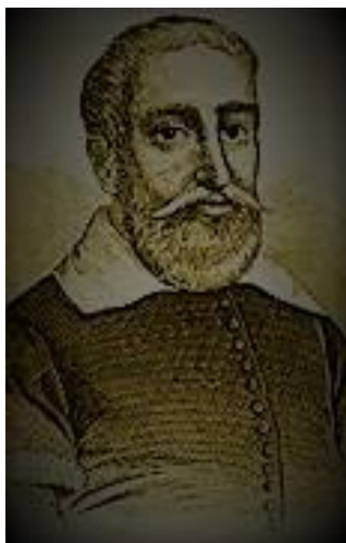
Szenczi Molnár Albert

447 éve született SZENCZI MOLNÁR ALBERT (Szenc, 1574. aug. 30. – Kolozsvár, 1639. jan. 17.) nyelvtudós, filozófus, zsoltárköltő, egyházi író, műfordító. Nagyapja Mátyás király katonája volt, a Székelyföldről került Pozsony vármegyébe, hol molnár lett, apja is az volt. 1584-től Szencen, 1586-ban Győrben, 1587-től Göncön, 1588-tól Debrecenben tanult. 1590-ben Kassán volt nevelő. 1590-től Wittenbergben, 1592-ben Heidelbergben, 1593-tól 1596-ig Strassburgban, 1597-től 1599-ig Heidelbergben tanult. Majd 1600-ig Szencen tartózkodott és bejárta a Felvidéket. 1600-tól Herbornban tanult. Sokfelé járt külföldön, főleg német nyelvterületeken. 1624-ben hazajött Kassára, ahol Bethlen Gábor gondoskodott ellátásáról, s így kizárólag tudományos és írói tevékenységet folytatott. 1626-tól haláláig Kolozsvárt élt. Céltudatos tudós volt, ki egész élete művével használni akart. Latin szótárával, mely átdolgozásokkal a 19. sz. közepéig használatban volt, megnyitotta a magyar értelmiség előtt az utat az európai tudományosság felé. Latin nyelvű magyar nyelvtanával Sylvester János után elsőnek ismertette meg Európával a magyar nyelv sajátosságait. A református egyházat megajándékozta a zsoltárokkal, a javított Károlyi-bibliával, Kálvin Institutiója fordításával, a Heidelbergi Kátéval, a Scultetus-féle prédikációgyűjteménnyel. Hatása a magyar irodalmi nyelv, a magyar verselés fejlődésére korszakalkotó.