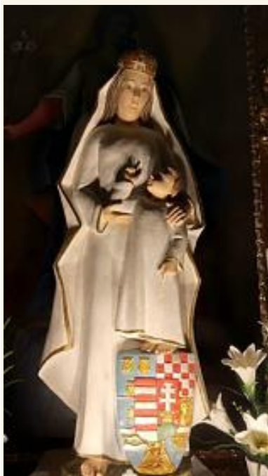
A fatimai Magyarok Nagyasszonya kegyeszobor

szellemi-lelki erő, amelyet a Boldogasszony iránti ragaszkodásunkban is megmutattunk. Ha visszapillantunk a nagy történelmi eseményekre, elcsodálkozhatunk, micsoda sebeket ejtett rajtunk az ezer év.