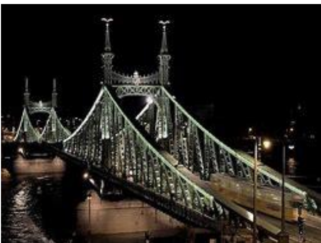
Szabadság híd (korábban: Ferenc József híd)