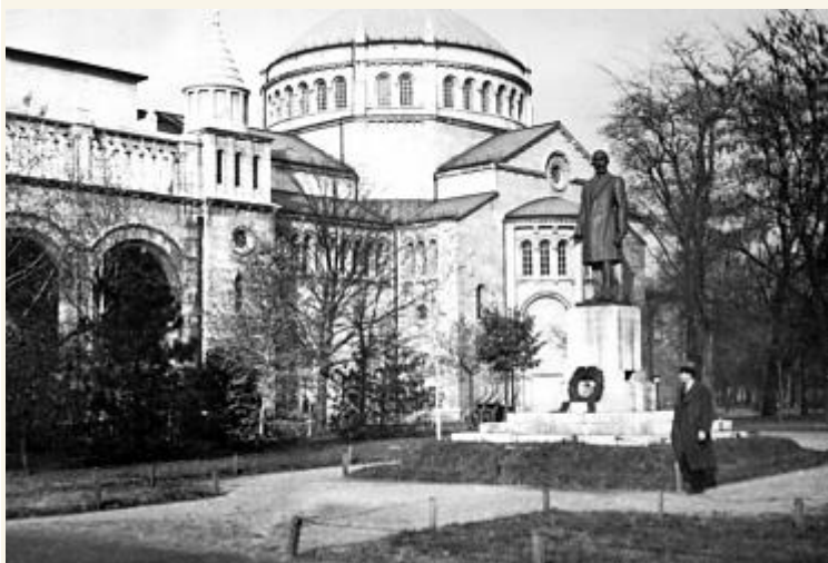
A Regnum Marianum 1938-ban, előtte Csengery Antal szobra