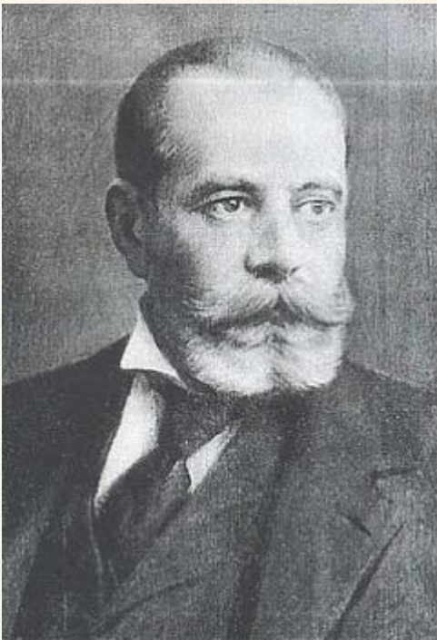
Puskás Tivadar, a telefonhírmondó megalkotója

„Puskás Tivadar feltalálói érdeme és a hírmondó találmány voltának nagyszerűsége nem egy műszaki újdonságban rejlik. Az igazán nagyszerű és zseniális vállalkozásban az, hogy végül is a világon első és jó harminc évig egyetlen ilyen jellegű szolgáltatás volt. Nem volt ő feltaláló, de volt (...) a „vállalkozás költője”. (Magyar Nemzet 1993. március 12)