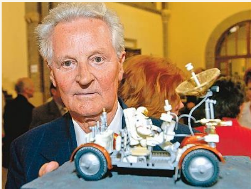
Pavlics Ferenc a híres űrjármű modelljével

Pavlics Ferenc 1928. február 3-án Balozsamegyyesen, egy Vas megyei kis faluban született. Gépészmérnök, az Apollo programban használt holdautó, a Lunar Roving Vehicle létrehozásának kezdeményezője, a jármű tervezője és főkonstruktor. 1971-ben az ő vezetésével fejlesztették ki az először, az Apollo-15 űrhajóval felbocsátott NASA-holdjárművet.