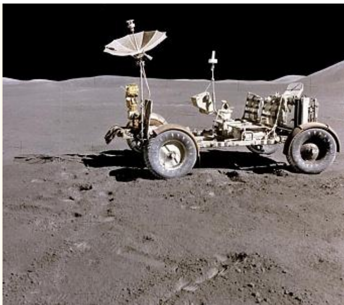
A Holdautó a Hold felszínén, használatra készen

A jármű igazi jelentősége abban állt, hogy az asztronauták számára nagyobb kísérleti lehetőségeket biztosított. E nélkül ugyanis csak 10-20 méter távolságra tudtak „elsétálni” és talajmintákat gyűjteni, a járművel viszont a három út során csaknem 80 kilométer távolságot tettek meg. Így a kutatás szempontjából olyan geológiailag fontos helyekre is eljuthattak, ahová egyébként értelemszerűen nem. A szonda biztonsági okokból a legsimább helyen szállt le, a holdautóval pedig az asztronauták eljuthattak a tudósok számára sokkal izgalmasabb sziklák, hegyek, szakadékok vidékére is.