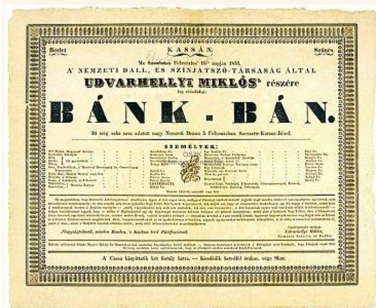
A Bánk bán első előadásának színlapja

„Hazám, hazám, te mindenem! Tudom, hogy mindenem neked köszönhetem. Arany mezők, ezüst folyók, Hős vértől ázottak, könnytől áradók.”