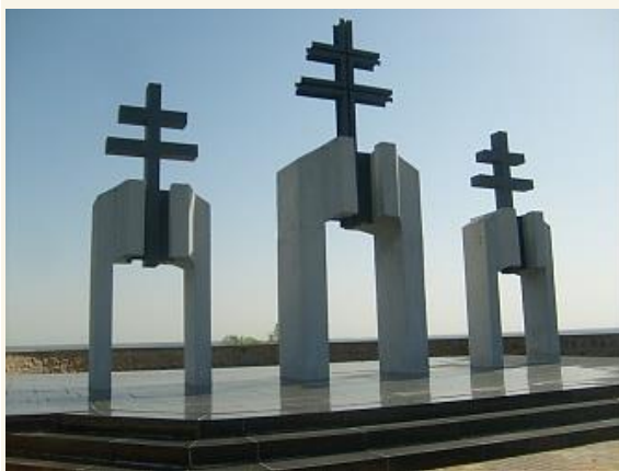
A rudkinoi emlékmű három kettőskeresztje

1943 januárjában a szovjet hadsereg által megindított általános támadás következtében esett áldozatul a Voronyezs térségében harcoló 2. magyar hadsereg; 40 ezren veszítették életüket, 70 ezer katona került fogságba, akik közül szintén tízezrek pusztultak el.