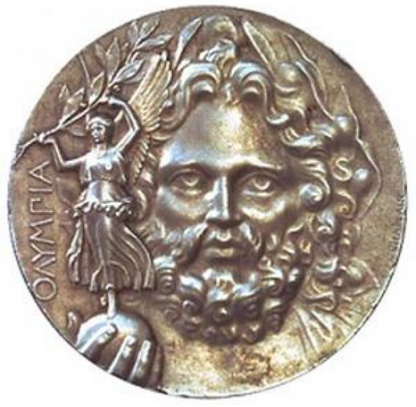
Az első magyar olimpiai győzelem érme

Hajós Alfréd (Budapest, 1878. február 1. - Budapest, 1955. november 12.) magyar építészmérnök. Az első magyar olimpiai bajnok, az első újkori olimpia kétszeres úszóbajnoka, többszörös Európa-bajnok, az 1924-es párizsi szellemi olimpia építészeti kategóriájának győztese. A magyar sportnak alig van olyan területe, amellyel Hajós Alfréd ne került volna kapcsolatba. Az első magyar olimpiai bajnok egymással távoli rokonságban sem álló sportágakban próbálta ki magát. A különböző sportágakban nyújtott kiemelkedő teljesítményei, valamint a sportélet fellendítése érdekében végzett társadalmi és szakmai (építészmérnöki) munkája alapján joggal nevezhető sportpolihisztornak, megfelelő a kor ideáljának.