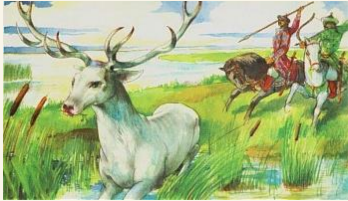
László Gyula: A csodaszarvas üldözése

jó, az észrevétlen beleépül régészetünkbe, köztudatunkba, ami pedig esendő azt úgylis elemészti az idő."