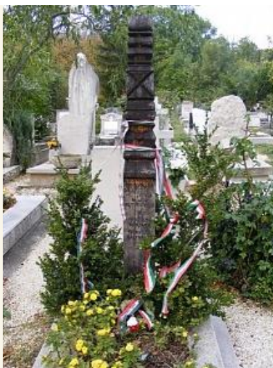
Nyughelye a Farkasréti temetőben

Szerinte az egyik történelem 670 táján az onogur-magyar földművesekkel kezdődött és a jobbágyság történetével folytatódott, a másik pedig a nemesség történetét foglalja magában a 896-os honfoglalástól kezdődően. A két történelem 1848-ban: a nemzeti érdekegyesítés, a jobbágyfelszabadítás, a jog- és teherenyelőség megvalósításával egyesült. László Gyula a tanítványaira hagyta örökül az előbbi, nagyrészt még megíratlan történelem kutatását, hiszen ő egész életében a szegény emberek régésze akart lenni.