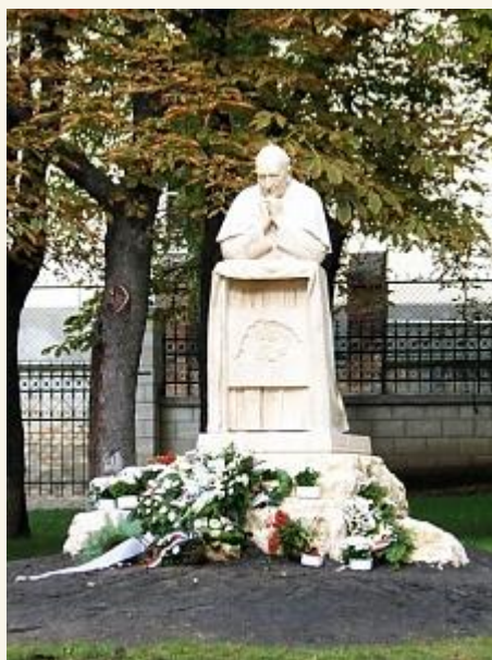
A budaörsi Mindszenty szobor

Folytatta a politikai küzdelmet és elítélte a németek kitelepítését, a katolikus sajtó korlátozását, ezáltal egyre inkább az antikommunista magyar politika vezéralakjává vált. Síkra szállt a kereszténydemokráciáért, a keresztény erkölcsi törvényeken alapuló társadalomért, amit egyetlen lehetséges alternatívaként tudott elképzelni szemben a kommunista és a magyar baloldali pártok által hirdetett szocializmussal és népi demokráciával.