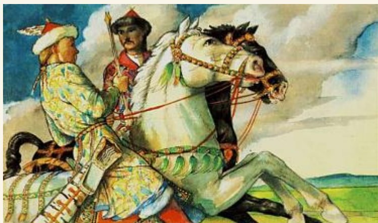
Hunor és Magor - László Gyula rajza

Fodor István majd fél évszázaddal később így értékelte a könyvet: „A 40-es évek elejétől honfoglalás kori régészetünk kutatásában is igen jelentős szemléletbeli változásokat hozott László Gyula munkássága. Az egykori élet teljességének megismerésére törekvő kutatási módszere magába foglalta a honfoglalóinknál megfigyelt jelenségek eredetének vizsgálatát is, amely szinte az egész eurázsiai térséget átfogta. Idevágó első eredményeit a honfoglalók életerői írott nagyszerű munkájában foglalta össze 1944-ben. A 40-es és 50-es években elmélyülten foglalkozott a magyar őstörténet régészeti nyomainak felkutatásával, s elméleti szinten világosan megfogalmazta a tennivalókat”