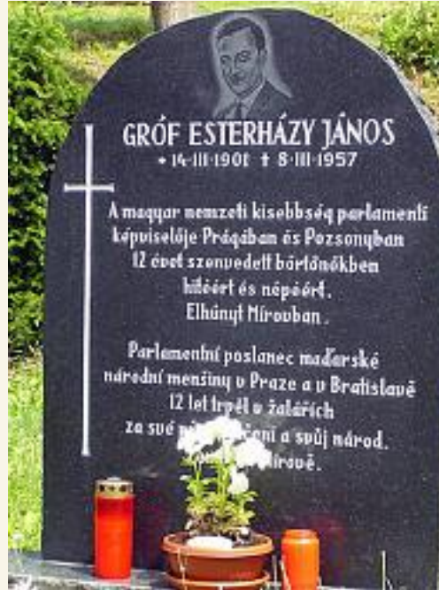
A várbörtön mellett felállított jelképes síremléke

A szlovák parlamentben Esterházy János volt a hivatalos szlovák politika egyetlen ellenzéke. Konzervatív emberként egyaránt elutasította a bal- és jobboldali szélsőségeket. Sohasem vált az egész államberendezkedést egyre inkább meghatározó náci ideológia kiszolgálójává. („A mi jelünk a kereszt, nem pedig a horogkereszt” - mondta.) Fábry Zoltán a fasizmus egyetlen szlovákiai ellenfelének nevezte.