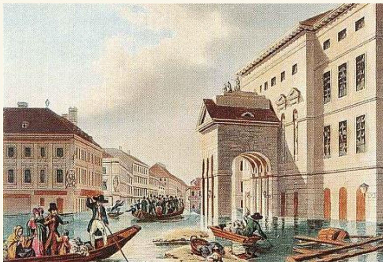
John Hürlimann: Árvíz a pesti Színház-téren, 1838

„Soha, semmiféle hatalom nem lesz képes a Dunát szabályozott partok közé szorítani.” (Korabeli vélekedés.)