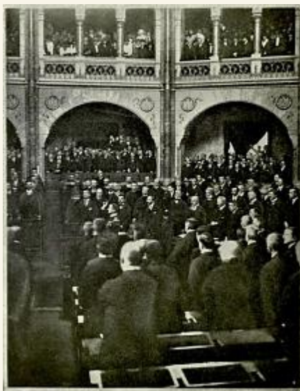
Horthy leteszi a kormányzói esküt a Nemzetgyűlésben

Az alkotmányos államműködés helyreállításához vezető úton az első lépcsőfokot egy ideiglenes törvényhozó testület, a nemzetgyűlés választása jelentette. 1920 januárjában tartották meg a parlamenti választásokat.