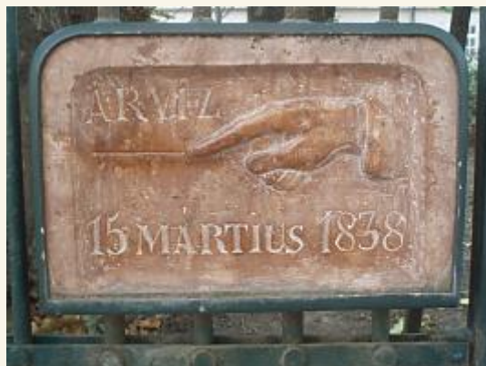
Az árvíz szintjét jelző tábla a Nemzeti Múzeum kerítésén

Magyar Természettudományi Múzeum - új épületében tízezer menekült kapott szállást (erre emlékeztet a főbejárati kapualjban ma is látható tábla).