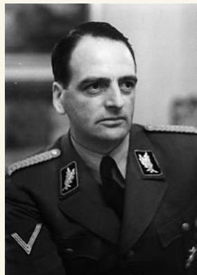
Veessenmayer, Magyarország teljhatalmú ura