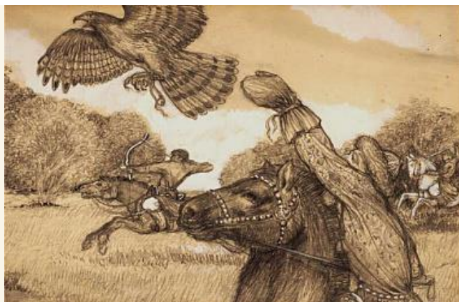
László Gyula: Vadászat – solymászat

Az egyre nagyobb számú temetői ásatások leleteiből László Gyula arra a következtetésre jutott, hogy a 670-680 körül a Kárpát-medencébe keletről beáramló késő-avar (onogur vagy onogundur) népnek és Árpád népének régészeti hagyatékai igen jól elkülönül (más a temetkezési módja. Más a fegyverzet, a viselet, a lószerszám stb.). E két nép temetőinek térképre vetítése azt mutatja, hogy nagyrészt nem egymásra települtek, hanem egymást mozaikszerűen kiegészítve népesítették be a Kárpát-medencét, és nyoma sincs egyfajta hódítás eredményeként bekövetkező pusztításnak vagy rátemetkezésnek.