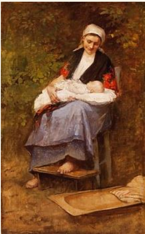
Deák Ébner Lajos: Anya gyermekével

„Hogyha minden csillag csupa gyémánt volna, minden tavaszi rügy legtisztább gyöngy volna: kamatnak is kevés, nagyon kevés volna... Hogyha minden folyó lelkemen átfolyna s ezer hála-malom csak zsoltárt mormolna, az én köszönetem így is kevés volna.”