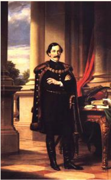
Barabás Miklós festménye

„A hon első bölcse, Deák Ferencz, elfogult kebellemel mondá ki, hogy ily gyász órában a bölcseségnek nincsen hangja. Az ülés szomorúan feloszlott. És a képviselők, a nagy komoly férfiak, a mint helyeikről fölállva, egymás égő szemeibe tekintenek, nem állhaták tovább az erőszakot, hanem zokogásra fakadva, borultak egymás nyakába, és sírtak, mint apát vesztett gyermek, - és azt szivszakadás volt látni. A ki érti e szavak súlyát: Teleki László meghalt; az ne szégyenlje könnyei hullását, mert bizony nem egy ember, hanem egy ország fájdalmát siratja abban.”