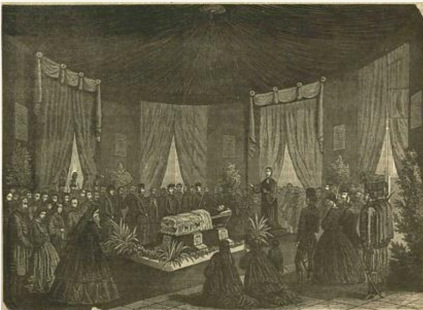
Gróf Teleki László gyászravatala május 9-én és 10-én Pesten a Nemzeti Múzeum előcsarnokában

„Odaadtam a becsületemet. Hogy megtegyem, amit a becsület kíván.” - E szavakkal távozik 1860 szilveszterén a bécsi Burgból Ferenc József császár kegyelméből Teleki László, Illyés Gyula róla szóló drámájában. A reformkor, a szabadságharc, és a Habsburg-önkényuralom idején élt arisztokrata demokratának rajongó hazaszereteténel csak szeplőtlen személyes becsülete volt fontosabb. „Európa legszótartóbb férfia” beleesett a csapdába - elfogadta a császár feltételeit, de hazatérte után nem sokkal - „közkívánatra” - a forrongó, függetlenségi politikai tábor élére állt. Az 1861 áprilisára (12 év után először) a császár által összehívott országgyűlésen elvállalta a határozati párt vezetését, egyúttal azt, hogy a mérsékelt, óvatos, kiegyezéspárti Deákkal szemben határozottan követeli a bécsi udvartól a '48-as törvényes állapot és az ország területi egységének visszaállítását.