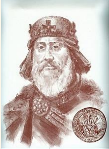
IV. Béla és pecsétje

„egész Európa, egész kereszténység, egész emberiség - ezért van a magyar”