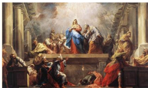
Jean II Restout: Pünkösd

„És adok néktek új szívet, és új lelket adok belétek, és elveszem a kőszívet testetekből, és adok néktek hússzívet. És az én lelkemet adom belétek, és azt cselekszem, hogy az én parancsolatimban járjatok és az én törvényeimet megőrizzétek és betöltsétek.”