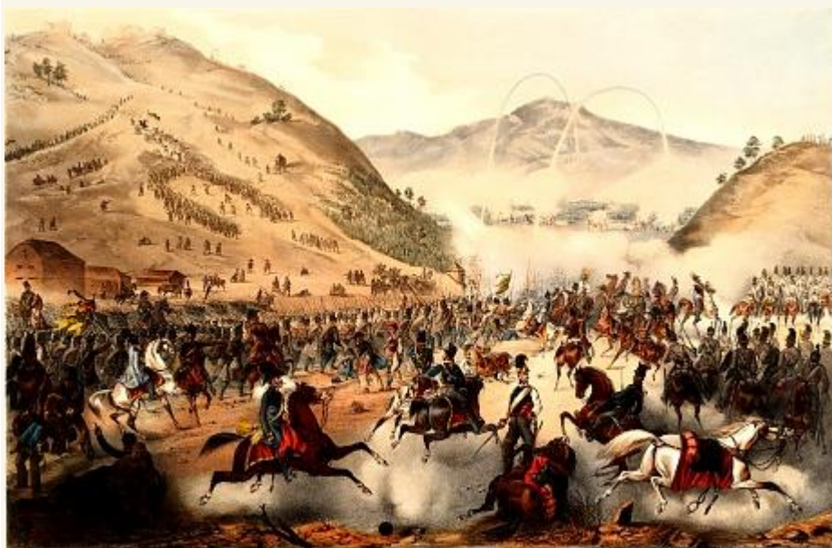
A pákozdi csata - Franz Xaver Zalder litográfiája

Az 1848. szeptember 29-én megvívott pákozdi csata volt az 1848-49-es forradalom és szabadságharc első jelentős ütközete, egyben az első győztes csatája. A magyar honvéd hadsereg nem a tényleges elnyomóival, hanem az általuk támogatott Jelasics vezette horvát hadsereggel vívott meg. E furcsa jelenség magyarázatát az előzmények vizsgálatában találhatjuk meg.