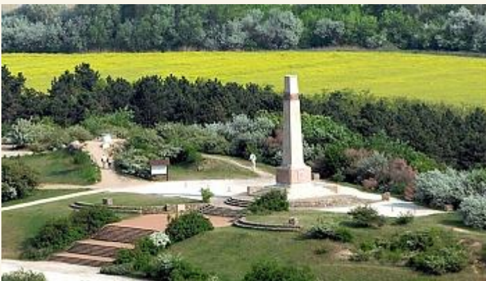
A pákozdi emlékmű

A nádor először tárgyalásos úton megpróbálta rendezni a horvát-magyar konfliktust, szeptember 23-án pedig - V. Ferdinánd utasítására - Bécsbe utazott, és soha többet nem tért vissza. A honvédsereg tehát teljes zűrzavarban várta Jellasics érkezését, miközben mindenki tisztában volt azzal, hogy a magyaroknak két lehetőségük van: vagy legyőzik a horvátokat, vagy ellenkező esetben a bán bevonul Pestre, és megsemmisíti az eddigi vívmányokat.