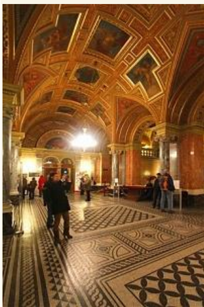
Az Operaház főbejárata

A Magyar Állami Operaház Magyarország egyetlen nagy létszámú társulattal rendelkező és kimondottan operákra, balettekre szakosodott színháza. Az első társulatot 34 énekes, 81 tagú kórus, 75 tagú zenekar és 30 fős balettkar alkotta. A társulat kezdetben sem létszámban, sem pedig színvonalban nem volt képes megfelelni a mindennapi színjátszás követelményeinek, ezért hamarosan művészi válságba került. Ehhez anyagi problémák is társultak, mert a pesti közönség nem volt képes viselni a produkciók költségeit. 1888-1891 között az intézmény igazgatója Gustav Mahler lett, az ő nevéhez fűződik a társulat első „aranykora”. Az első világháború kitörése erősen visszavetette a színház fejlődését, az Operaház egy évre be is zárt.