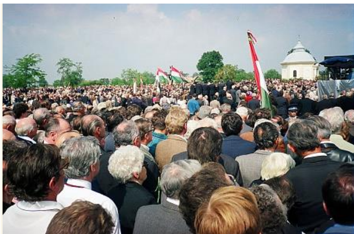
Horthy újratemetésén a résztvevő tömeg egy része

Horthy Istvánné írta: „Érdekes volt a rendőrökkel elbeszélgetni; elmondták, hogy még sohasem volt ilyen tömeggel dolguk, mint amilyen a temetésen megjelent.” A példászerűen megrendezett szertartás azonban nem állami ceremónia volt. Az Antall-kormány tagjai, látva a baloldali és liberális ellenzék harsány ellenzését, nem merték felvállalni, hogy Magyarország volt kormányzójának állami, méltóságát megillető temetést szervezzenek, az eseményen csak magánemberként vettek részt.