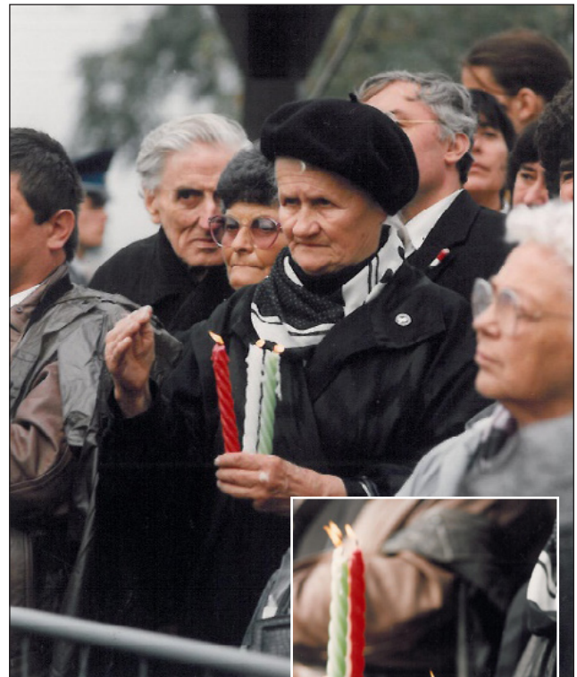
Kegyelet, tisztelet, szeretet...

1993 – az újratemetés. Pontosan nem lehetett megállapítani, hányan tették tiszteletüket, s fejezték ki részvétüket a kormányzó utolsó útján, akit – mint oly sok nagy magyart – száműzetésben ért a halál, nem láthatta már oly nagyon szeretett magyar hazáját. Történetes kutatósaiban megjelent szám szinte hihetetlen: 55-60.000 (!) főre becsülik a kegyeletüket lerovó emberek számát, pedig a hivatalos magyar sajtóban semiféle tájékoztatás az újratemetésről nem volt!