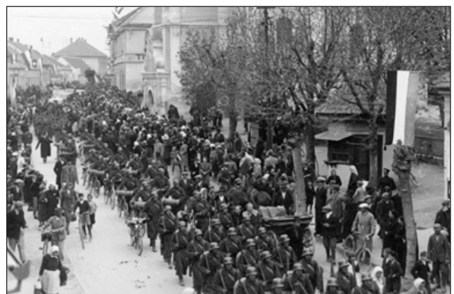
Délvidék, 1941. április