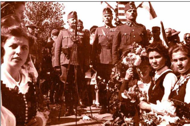
Sepsiszentgyörgy: a magyarság Székelyföld-szerte virág- esővel fogadta a magyar katonákat