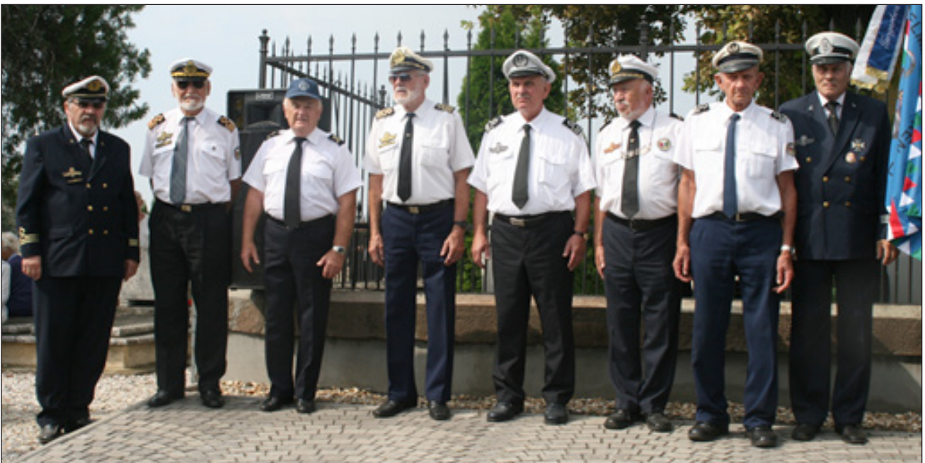
2018 - Magyar Tengerészek Egyesületének (MATE) díszegysége az újratemetés évfordulóján

Gondolkodjunk, mérlegeljünk, kutassuk az akkori körülményeket, szűrjük le az igazságot, s tegyük méltó helyére a magyar történelem panteonjában az egyik legnagyobb történelmi személyiségünkkel kapcsolatos értékítéletünket.