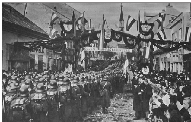
Losonc, 1938. november 10.