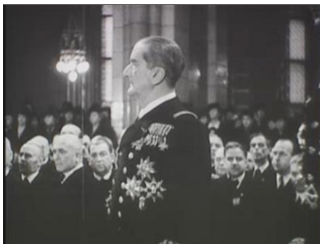
Horthy kormányzó parlamenti felszólalása közben

Hatvanegy esztendeje hunyt el az utolsó legitim államforma vezető politikusa, a Magyar Királyság kormányzója