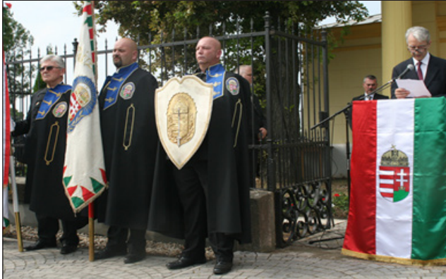
Történelmi Vitézi Rend díszőrsége a megemlékezés alatt – Kenderes, 2018. szeptember 9.

– nem csak a Vitézi Rend tagjainak kötelessége, de elvárható minden magyartól, akiknek számít az, hogy magyar Magyarországon, szabadon és demokráciában élhetünk, akiknek történelemismerete meghaladja a posztkommunista ideológiákon alapuló ismereteket, akiket nem vezethetnek félre a média áligazságai.