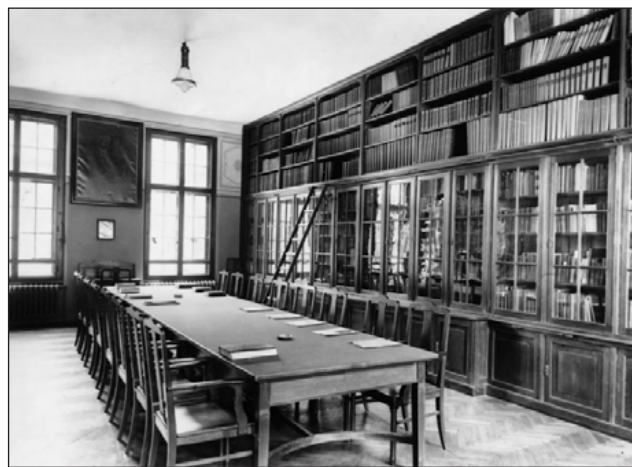
Állam- és Jogtudományi Kar szeminárium helye, Budapest (1930-as évek)

A művelt középosztály megteremtése céljából életre hívta a Napkelet című irodalmi folyóiratot 1923-ban. A lap főszerkesztőjének Tormay Cécile-t kérte fel.