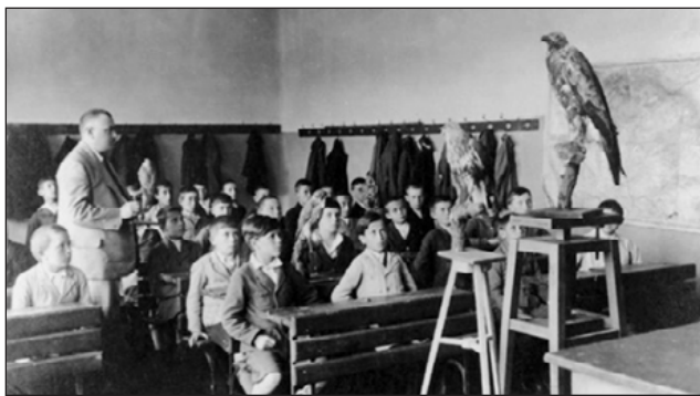
Természettudományi óra a battonyai fiúiskolában (1930 körül)

Tanoncképzés: 1924-ben lépett életbe az új tanonciskolai szervezeti szabályzat és tanterv. A törvény kimondta, hogy minden község, amelyben az iparos- és kereskedőtanoncok száma eléri a negyvenet, köteles tanonciskolát állítani. Az iparostanonc-iskolák három évfolyamból álltak. A tanulók nem fizettek tandíjat. A tanév tíz hónapig tartott, a tanítás ideje heti kilenc óra volt, a többi gyakorlati oktatás. Az iskolalátogatásra fordított időt a tanoncok munkaidejébe be kellett számítani. A gyakorlati képzést a tanoncok a kisiparosok műhelyeiben vagy a vállalati tanműhelyekben kapták,