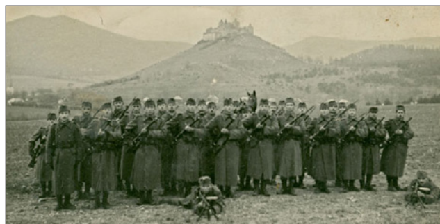
Egri bakák Krasznahorka „büszke vára” alatt.