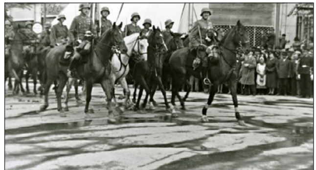
Délvidék, 1941. április