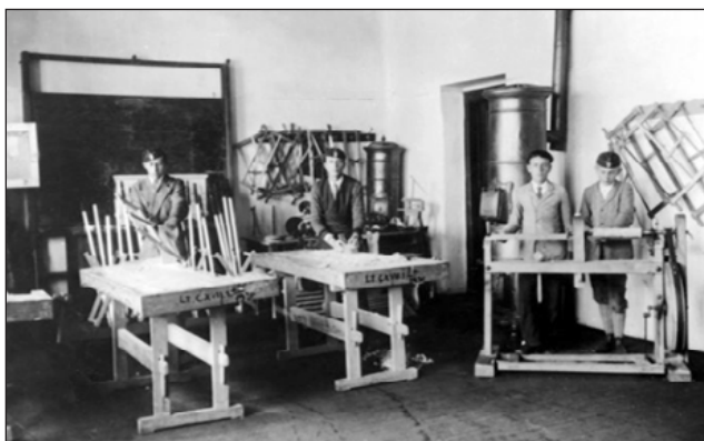
Polgári fiúiskola műhelye, Battonya (1930)

ba úgy kerüljenek a fiatal tanítónők és tanítók, hogy ezzel növelhesse az összeházasodás és letelepedés lehetőségét. A tanárképzésre különben is nagy gonddal ügyelt, és azt hangsúlyozta, hogy a „magyar oktatótól, kezdve a kis óvónőn fel az egyetemi tanárig” azt az egyet követeli meg, hogy „ne csak tanítsa, hanem szeresse a magyar gyermeket.” A tanárképzés reformját 1924-ben vezettette be. A középiskolai tanárképzés 1927/28-ban életbe lépett új rendje és a tanárképző intézetek új szervezeti szabályzata lényegében 1949-ig érvényben maradt. Eszerint a tanárjelölteknek a negyedik félév lezárása előtt alapvizsgát, a nyolcadik félév előtt szakvizsgát, az egy tanéven át tartó gyakorlóév után pedig pedagógiai szakvizsgát kell tenniük.