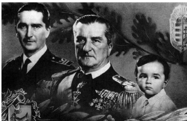
Horthy Miklós István fiával és unokájával, a kis Istvánnal

Az országban a „Kiskormányzó” igen nagy népszerűségnek örvendett, angolbarát politikája egyedülálló volt a térségben. A frontszolgálat alatt (utolsó találkozásuk alkalmával, augusztus 14-én, Kijevben) már feleségével is megosztotta azt az álláspontját, hogy a németek már elvesztették a háborút.