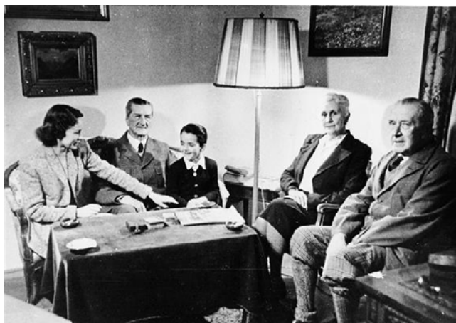
A Horthy-család az emigrációban. Ilona asszony támasza, segítsége volt apósának

„Egy csepp szomorúságot sem érzek, mert tudom, hogy itt van velünk, talán még közelebb, mint előtte. Tele vagyok derűvel, anyámban mély volt az Isten hatalmába vetett hite, hitt az öröklétben. ... Azt akarta, hogy a magyarok tanulják meg becsülni egymást, semmilyen ideológia nem érdekelt, csak az emberek érdekelték. ...Sosem álmodtam apámmal, de édesanyám halála előtt azt álmodtam, visszajött, és a kertünkben leszállt a kisrepülőjével. Később értetem meg, hogy érte jött. Köszönöm, hogy ilyen csodás édesanyám lehetett.”