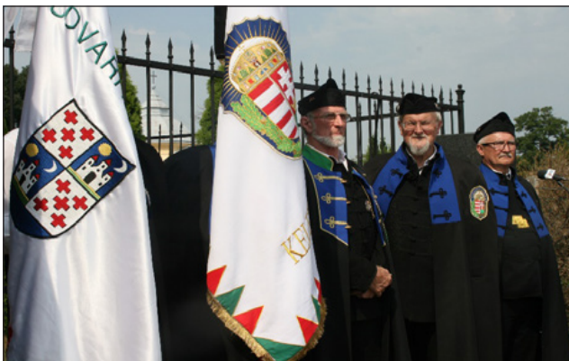
A Történelmi Vitézi Rend Székelyudvarhely Széke és Közép-Magyarország Kelet Törzsszék közös díszőrsége. Fotók: v. T.E.

Akik értik és tudják, hogy az akkori vészes történelmi helyzetekben, melyek 1920-ban, a kormányzó megválasztása (1920. március 1.) előtt már tragikusan sújtották a nemzetet, s a trianoni katasztrófa érzékelhető közelségbe került, milyen emberi-politikusi felelősséggel lépett, s határozta meg kormányzásával az ország jövőjét. Elég, ha csak az I. világháborúban elszenvedett katasztrófális veszteségeinkre, s a tanácsköztársaság pusztításaira gondolunk! Bár az antant rokonszenve Horthy felé egyértelmű volt, az államfő helyzetét a belső bomlasztó, kommunista-liberális eszmékkel szembeni fellépésével tudta csak stabilizálni. Történelmi tett, mely által lehetővé vált, hogy 1944-ig nagyarányú, gyors és a csodával határos fejlődés mehessen végbe – a nemzet összefogása eredményeként; függetlenül attól, hogy milyen arcátlan hazugságok özönét zúdítja Magyarországra a nyugati sajtó, melyeknek alapja az oda menekült „magyar” kommunisták áligazságai, gyalázkodásai voltak. (Nem tehetek róla, de nagyon is 'déja vu' érzésem van, s talán nem is vagyok ezzel egyedül...)