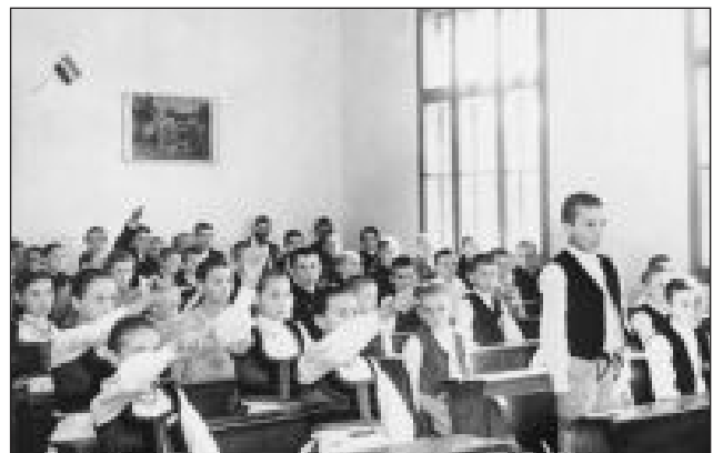
Iskolai óra Erdélyben (1940)