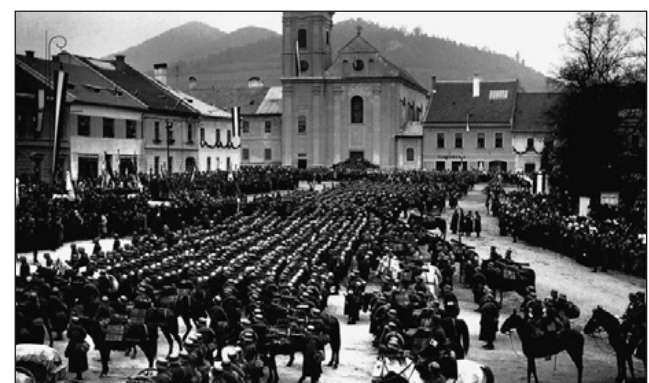
Kárpátalja, 1939. március 15.