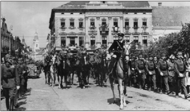
Erdély, Szatmárnémeti, 1940. szeptember 5.