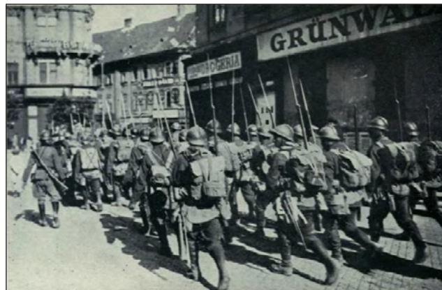
Román megszálló csapatok Budapesten, 1919-ben.

adásul egy olyan hiteles helyszínen, amely ténylegesen kapcsolható a kormányzó személyéhez. Ezek a szobrok a kormányzó kultuszának és a nevével fémjelzett csaknem negyedszázados korszaknak elismerő jelei, Horthy emlékének – még mindig erős ellenszélben és többnyire magánterületeken emelt – bástyái.