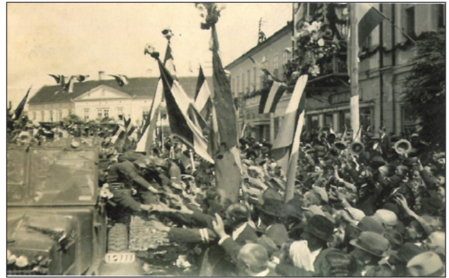
Az I. gépkocsizó zászlóalj bevonulása Sepsiszentgyörgyre 1940. szeptember 13-án