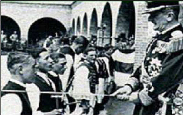
Vitézavatás, Székesfehérvár, 1938