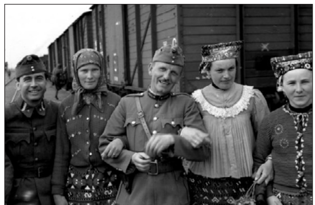
Délvidék, 1941. április