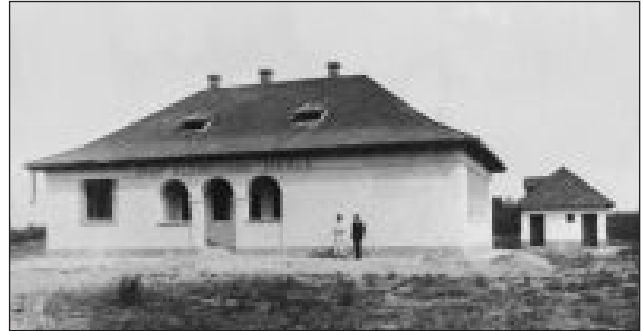
Ahogy a nép nevezte az iskolát Domaszéken: Gróf Klebsberg-iskola (Domaszék, 1920-as évek vége)

nyőből készült, padlóval épült iskolák melletti udvaron téglából épült WC-vel. Az iskolák mellett háromszobás tanítói lakásokat építettek. A népiskolai építési akció megvalósítására 1932-ig 47 500 000 aranypengőt, az ország egyévi állami költségvetésének mintegy a felét fordították. A magyar iskolarendszer többségében felekezeti, a történelmi egyházak által fenntartott iskolákból állt. A nemzetiségek lakta területeken ún.