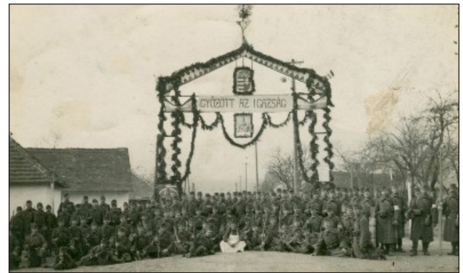
Egri honvédek egy felvidéki faluból.