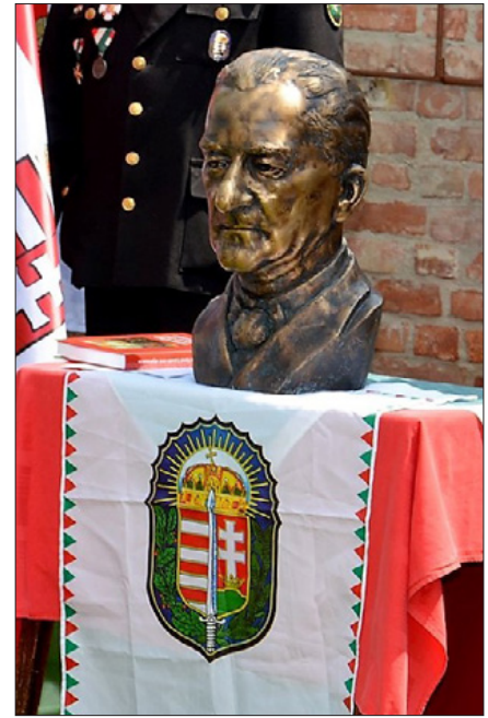
A szobor alkotója vitéz Csák Attila szkp. szobrászművész