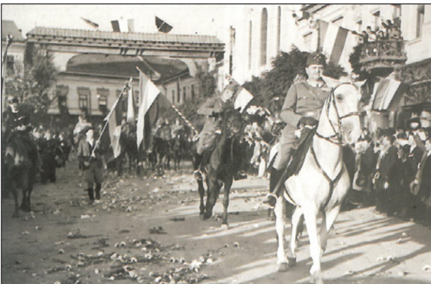
Vitéz nagybaconi Nagy Vilmos vezérezredes, az I. had- sereg parancsnoka bevonuló katonái élén 1940. szept- ember 10-én, Marosvásárhelyen