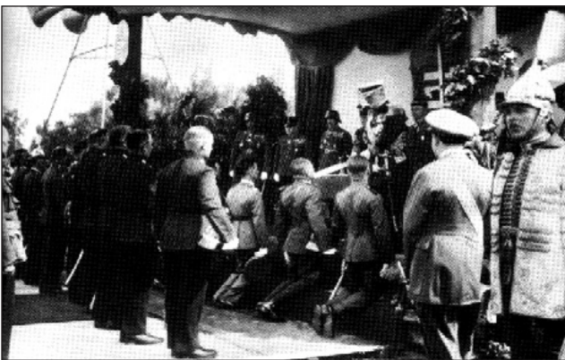
Vitézavatás, Szent Margit sziget

Nem hagyta el nemzetestvéreinket, akiket a Franciaország vezetésével tárgyaló győztes hatalmak a Trianon-palotában aláírt katasztrofális következményeket magában hordozó, békeszerződésnek csúfolt egyezmény alapján elszakítottak tőlünk. Akkor is kiállt a nemzetegyesítés politikája mellett, amikor már újra háborúba sodorta Magyarországot a nemzetközi nagytőke érdekszövetsége. Mindaz az óriási erőfeszítés és a világ csodálatát kiváltó gazdasági és kulturális fejlődés látszólag semmivé foszlott 1944-ben, amelyet Horthy kormányzása alatt elért az ország. A háború már olyan fordulatot vett, melyet a kormányzó megakadályozni, elhárítani nem tudott. Személyes, családi és nemzeti tragédia, melyet sohasem tudott feldolgozni. Bízott abban, hogy újra helyreáll az isteni igazság, a bűnösök meg kell, hogy bűnhődjenek. Amikor ennek halvány jele villant fel 1956-ban, megújult testi-szellemi erővel vetette bele magát a távolból, Hazájából érkező hírekbe, s bízott, hitt és remélt. Amikor már ezt a reményt is végérvényesen szétszaggatták, amikor már biztos volt, hogy hazatérnie már sohasem lehet, minden ereje elhagyta.