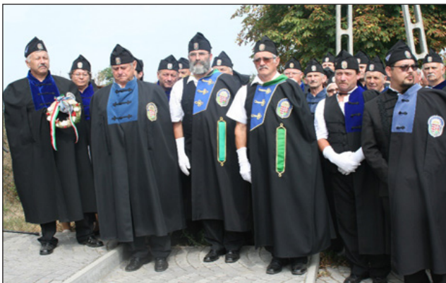
Történelmi Vitézi Rend, erdélyi törzsszékeinek 60 fős delegációja